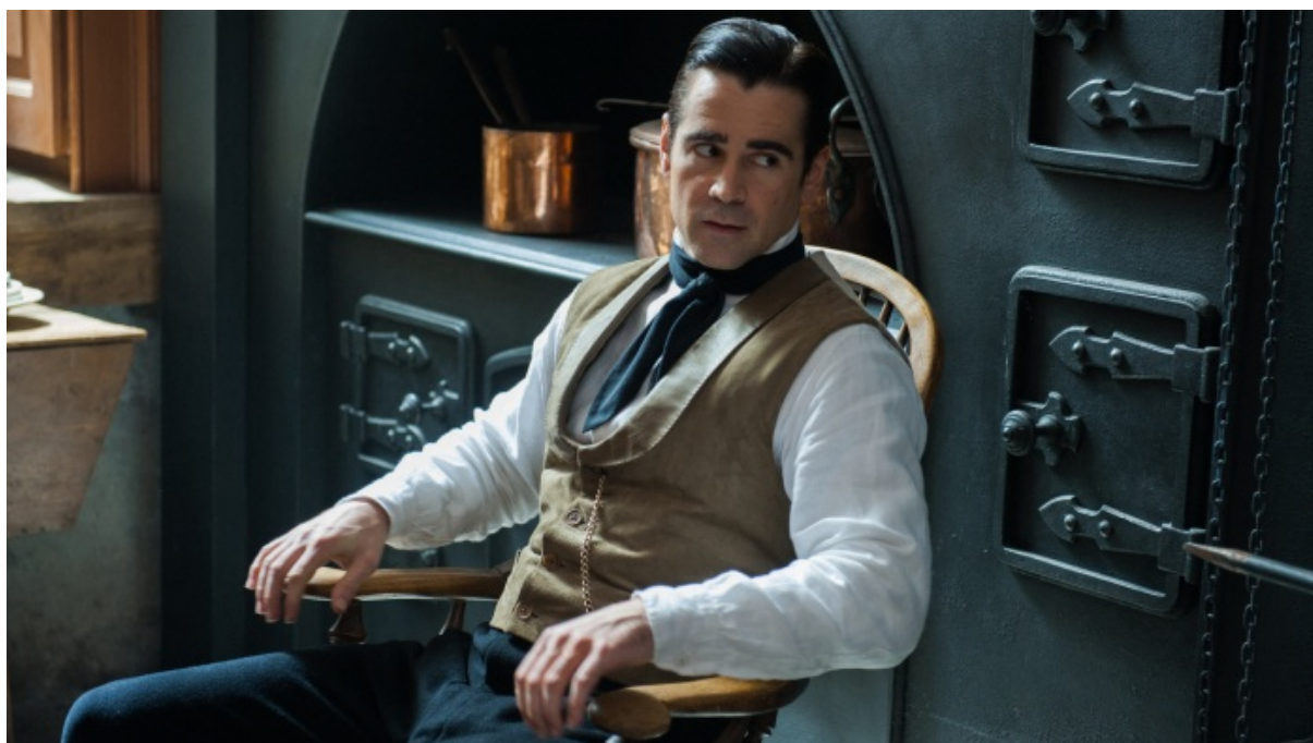
Colin Farrell – JOHN

De carrière van Colin Farrell (°31 mei 1976 – Dublin, Ierland) wordt gekenmerkt door zijn veelzijdigheid als acteur enerzijds en zijn turbulente privéleven anderzijds. De acteur staat bekend als een van de meest getalenteerde en succesvolle van zijn generatie. Hij werkte dan ook met grote regisseurs als Woody Allen, Oliver Stone en Terrence Malick.