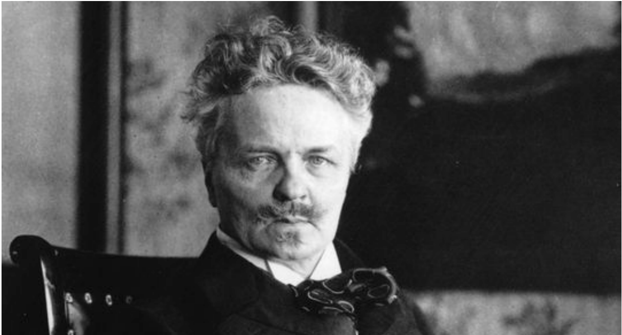
Johan August Strindberg – AUTEUR FRÖKEN JULIE