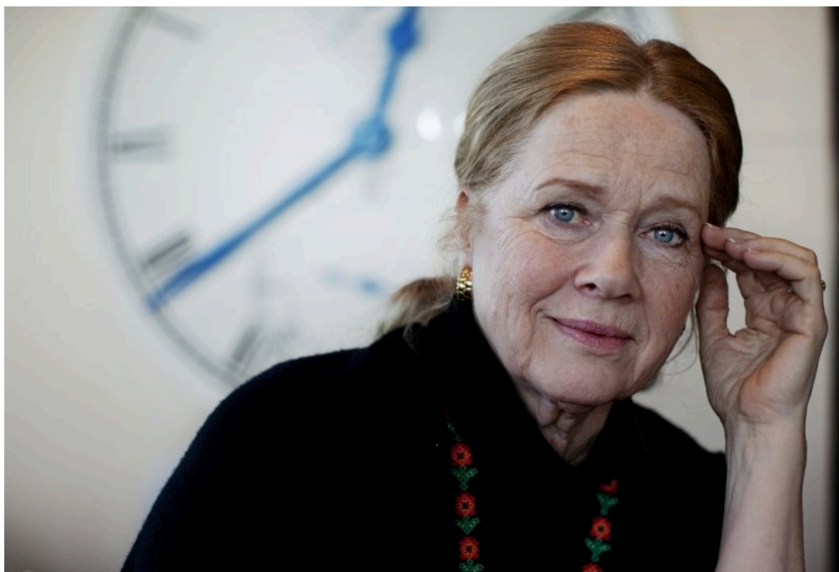
Liv Ullmann – Regisseur

De Noorse actrice en regisseur Liv Ullmann (°16 december 1938 – Tokyo, Japan) staat dankzij haar expressieve gezichtsuitdrukkingen, natuurlijke schoonheid en intelligente spel internationaal bekend als een van de "muzen" van de legendarische Zweedse regisseur Ingmar Bergman. Ze verscheen tenslotte in tien van zijn meest bejubelde films, zoals Persona (1966), Geschreeuw en gefluister (1972), Scènes uit een huwelijk (1973) en Herfstsonate (1978). Op die manier bouwt Ullmann haar reputatie als "leading lady van de Scandinavische cinema" in snel tempo op.