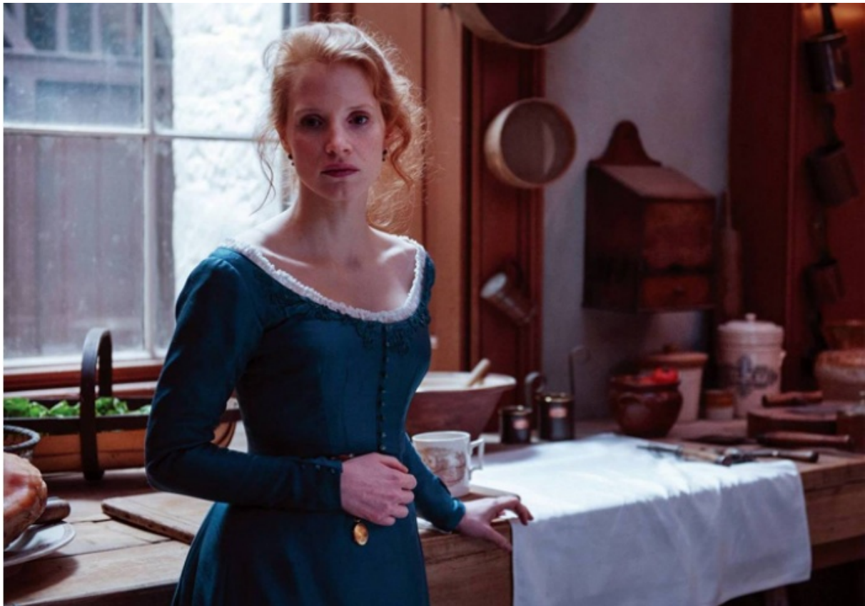
Jessica Chastain – MISS JULIE

De afgelopen jaren heeft de Amerikaanse actrice Jessica Chastain (°24 maart 1977 – Sacramento, Californië) naam gemaakt als een van de meest veelbelovende acteertalenten in Hollywood. Met pas vijftien films op haar naam heeft Chastain zich al met gemak op de kaart weten te zetten als Oscarwaardige Hollywoodvedette.